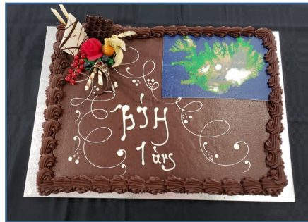
Eins og í öðrum afmælum var boðið upp á góða tertu í lokin.

Innan ÞÍH starfar öflugur, samhentur hópur sem hefur sinnt fjölmörgum málaflökum. Öll verkefni ÞÍH miða að því að þjónusta alla heilsugæslu í landinu.