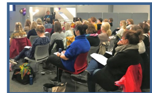
Frá námskeiði um nýtt vinnulag í ung- og smábarnavernd sem haldið var í húskakynnum ÞÍH.

ÞÍH hefur haldið nokkur námskeið á höfuðborgarsvæðinu og á landsbyggðinni til að kynna þetta nýja vinnulag.