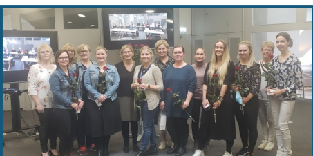
Útskrifaðir sérnámshjúkrunarfræðingar ásamt lærimeisturum sínum og kennslustjóra.

Sérnámsstöður veitast til eins árs í 80% starfshlutfalli. Árið 2021-22 eru átta sérnámshjúkrunarfræðingar í sérnáminu og starfa þeir hjá HH, HSS, HSU og HSN.