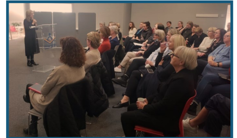
Frá vinnufundi 6. október

Hafin er formleg vinna við að straumlínulaga verklag í heilsgæslu á landsvísu fyrir fólk með langvinnan/fjölpættan heilsuvanda og eldra fólk.